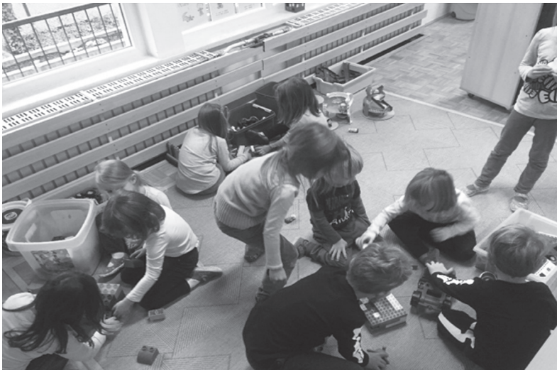
Slika 6.: Igra u centru građenja