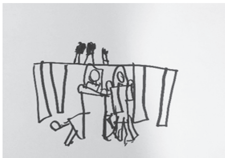
Slika 5.: Zajedničko crtanje

Sofija prijateljicu Ivonu kako rješavaju radne zadatke, a Petra svoje prijateljice Tenu i Sofiju kako crtaju (Slika 5).