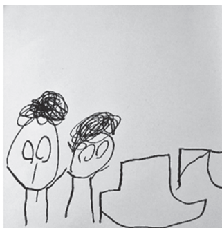
Slika2.: Igra na tržnici

Lav je crtao kućicu s vratima i svog prijatelja Otona kako sjede i razgovaraju (Slika 3).