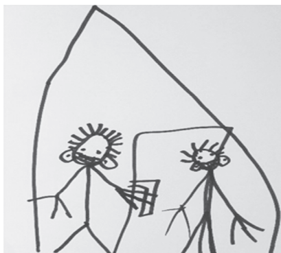
Slika 3.: Razgovor u kućici

Lav je crtao kućicu s vratima i svog prijatelja Otona kako sjede i razgovaraju (Slika 3).