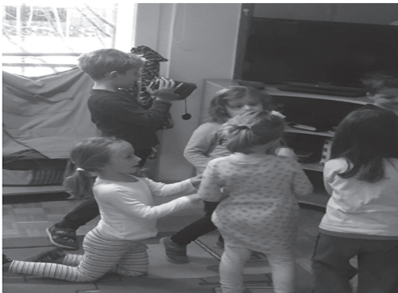
Slika 1.: Snimanje omiljenog centra

Centar građenja ( 4),Obiteljski centar (4),Stolno-manipulativni centar ( 1),Dramski centar (4),Tržnicu ( 4) iCentar početnog čitanja i pisanja (1).