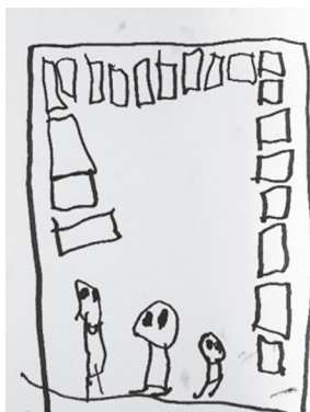
Slika4.: Igra domina

Petar svog prijatelja Ivana kako igraju domino (Slika 4).